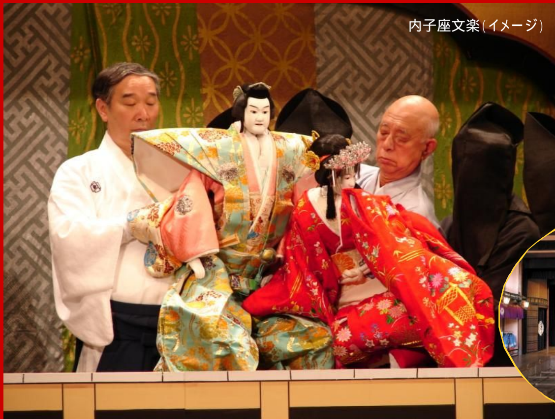
内子座文楽(イメージ)